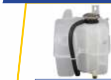
ਕੂਲੈਂਟ ਦੀ ਬਰਬਾਦੀ ਨੂੰ ਰੋਕਦੀ ਹੈ।