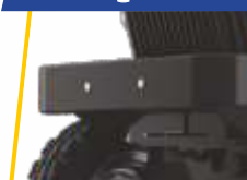
ਟ੍ਰੈਕਟਰ ਅਗਲੇ ਪਾਸੇ ਤੋਂ ਚੁੱਕਿਆ ਨਹੀਂ ਜਾਂਦਾ।