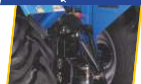
ਟ੍ਰੇਲਰ ਦਾ ਆਸਾਨ ਸੰਚਾਲਨ