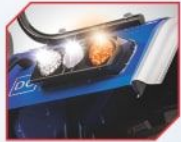
LED ਟੇਲ ਲਾਈਟ