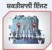
235 Nm ਟਾਰਕ ਦੇ ਨਾਲ ਤੇਜ਼ ਪਿਕਅੱਪ