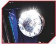
LED DRL ਹੱਡ ਲਾਈਟ