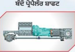
ਮੁਸ਼ਕਲ ਰਹਿਤ ਕੰਮ