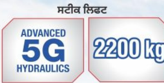
ਉੱਚ ਲਿਫਟ ਸਮਰੱਥਾ ਵਾਲਾ 5G ਹਾਈਡ੍ਰੌਲਿਕ