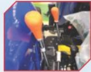
IPTO ਨਾਲ ਡਬਲ ਕਲਚ