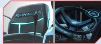
ਡੀਲੱਕਸ ਸੀਟ ਅਤੇ ਅਰਗੇ ਸਟੀਅਰਿੰਗ